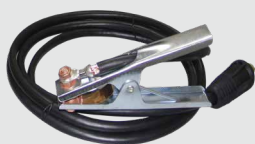
Cable Grapa a tierra 1.5m