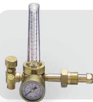
flujómetro de argón