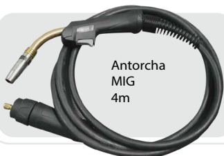
Antorcha MIG 4m